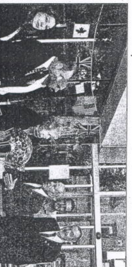
Les descendants de La Fayette accueillis pour une visite privée du musée Airborne.

ses invités, le président du musée a rappelé le rôle et les fonctions de ce musée qui est avant tout, un musée de la mémoire.