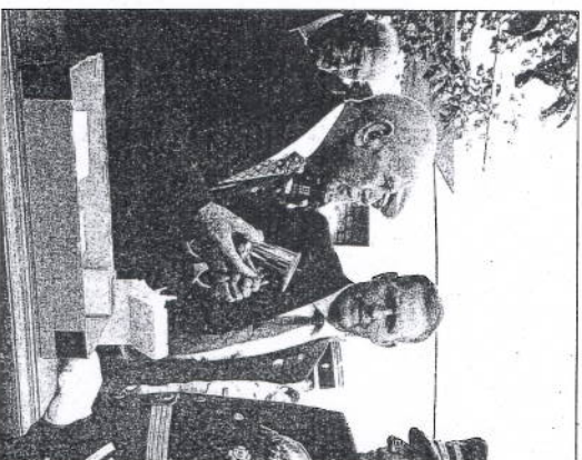
Echange de cadeaux et de félicitations.